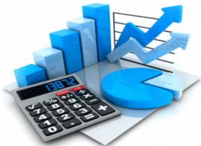
EJECUCION PRESUPUESTARIA 2021 EN BS.